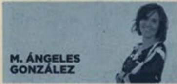
M. ÁNGELES GONZÁLEZ

Los 18 afectados reclaman en conjunto a Cajamar más de 69.000 euros por las cantidades cobradas de más antes de la sentencia del Supremo que anula esta condición